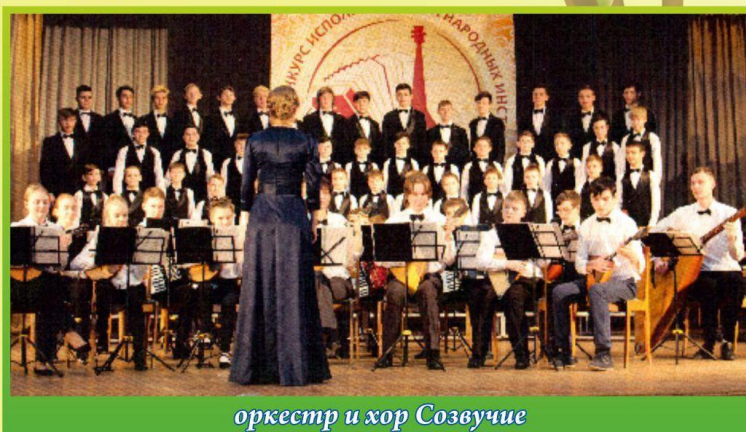
оркестр и хор Созвучие

Мы желаем всем участникам оркестра народных инструментов неугасаемого вдохновения, удачи и новых успехов!