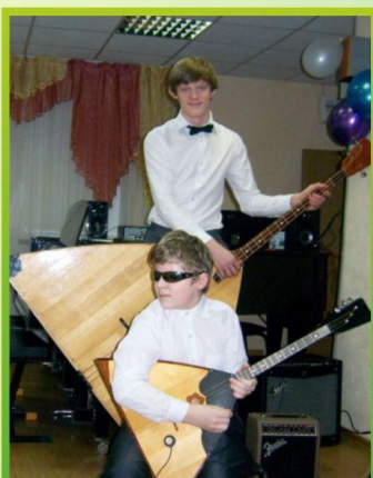
концерт 8 марта