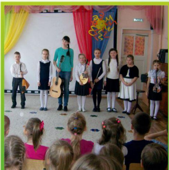
концерт в детском саду